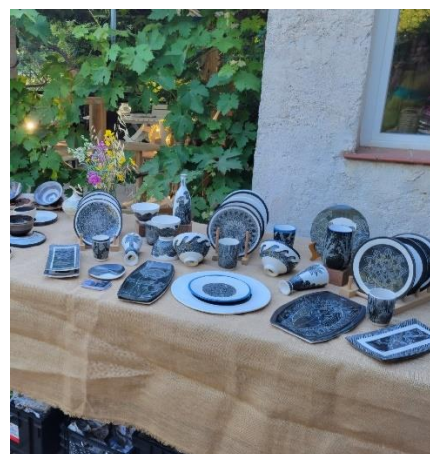
Morgane Lagorce Céramiste