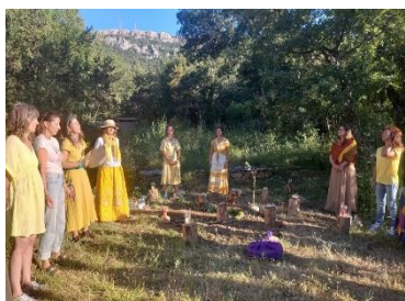
L'équipe du collectif en habits de lumière

Un rituel de célébration du solstice tout en créativité : ateliers autour des valeurs du collectif coanimés par les membres du collectif et activation du mandala par tout le groupe.